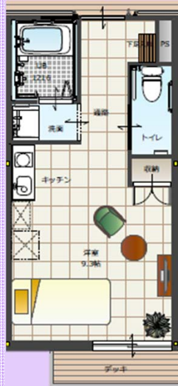
Cタイプ 105号 25.52㎡