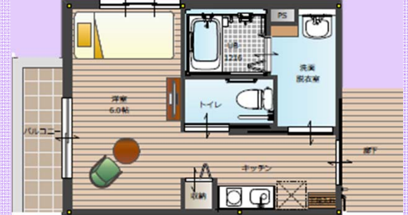
Cタイプ 230号 25.19㎡