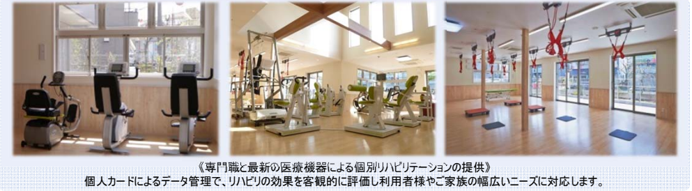
《専門職と最新の医療機器による個別リハビリテーションの提供》 個人カードによるデータ管理で、リハビリの効果を客観的に評価し利用者様やご家族の幅広いニーズに対応します。