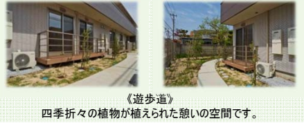
《遊歩道》 四季折々の植物が植えられた憩いの空間です。

アンジュカ初石は各ユニットや共有部分に様々なタイプの浴槽をご用意。できるだけゆっくりと入浴を楽しんでいただけるように、個浴を多く設けています。同時に2箇所の機械浴も完備し、どのような身体状況の方でもご安心いただけます。